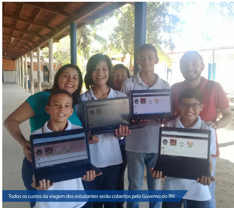
Todos os custos da viagem dos estudantes serão cobertos pelo Governo do RN